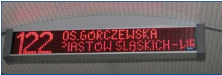
Wyświetlacz wewnątrz pojazdu.

Obecnie, na razie jeszcze bardzo prosty system informacji pasażerskiej, oparty m.in. na monitorach LCD funkcjonuje w nowych pociągach Stadler Flirt, należących do Kolei Mazowieckich, którymi można podróżować na podstawie większości biletów okresowych ZTM Warszawa.