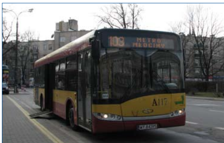
Autobus niskopodłogowy Solaria Urbino 12 wyposażony w składaną rampę dla wózków oraz funkcję „przykłąku”.

W przypadku trolejbusów sytuacja jest nieco bardziej skomplikowana, bo w zasadzie nie istnieje rynek wtórny tego typu pojazdów. Jednak i w tym wypadku można próbować niskim kosztem „uniskopodłogowić” tabor poprzez zakup używanych autobusów i ich przebudowę na trolejbusy. Takie działanie z dużym powodzeniem realizuje Gdynia.