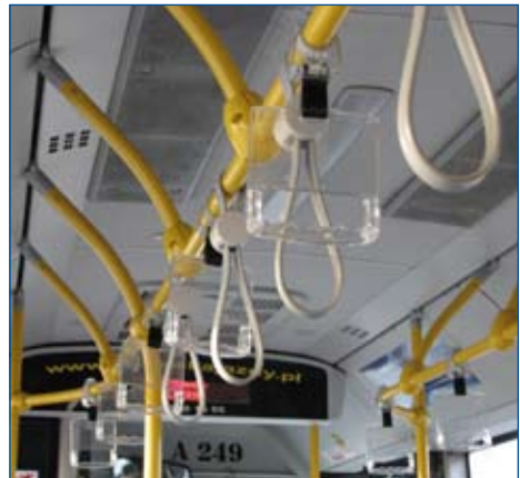
Uchwyty nieprzezroczyste i z miękkiego materiału nie stanowią zagrożenia dla słabowidzących i niewidomych. Niestety, w widocznym na zdjęciu pojeździe zastosowano także uchwyty wykonane z przezroczystego, twardego plastiku