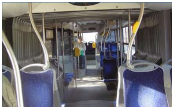
Szare poręcze są słabo widoczne i nie kontrastujące z resztą wyposażenia pojazdu.

Z kolei dla osób słabowidzących bardzo ważne jest stosowanie poręczy w kontrastowym , najlepiej żółtym kolorze . Kolor ten bowiem osoby te widzą najwyraźniej. Zastosowanie żółtych poręczy znacząco ułatwia słabowidzącym poruszanie się wewnątrz pojazdu i zwiększa ich bezpieczeństwo w czasie podróży.