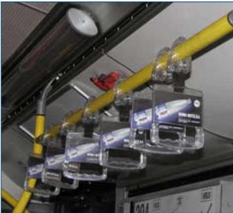
Uchwyty przezroczyste, wykonane z twardego materiału i posiadające ostre krawędzie mogą być niebezpieczne dla osób słabowidzących i niewidomych. (fot. Sławomir Moczulski)

W miejscach, gdzie nie należy montować pionowych poręczy np. w drzwiach czy w przestrzeni przeznaczonej do przewozu wózków, stosuje się często dodatkowe ruchome uchwyty zamocowane na poręczach podwieszonych pod sufitem. Bardzo ważne jest to, żeby uchwyty nie były wykonane z twardego materiału i żeby nie posiadały ostrych krawędzi. Istotna jest też ich barwa. Jest to zwłaszcza ważne dla osób niewidomych i słabowidzących, które mogą w nie uderzyć głową. Rażącem przykładem zastosowania wyjątkowo nieodpowiedniego wyposażenia tego typu jest montaż przezroczystych (!), posiadających ostre krawędzie uchwytów, wykonanych z twardego masywnego tworzywa sztucznego w warszawskich i szczecińskich autobusach.