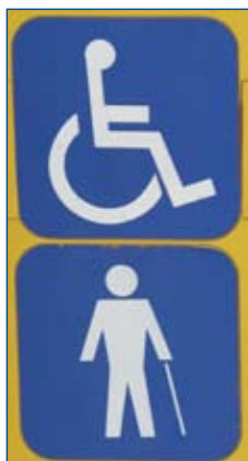
Piktogramy przy drzwiach.

Pojazdy komunikacji miejskiej dostępne dla osób niepełnosprawnych powinny być oznakowane międzynarodowym piktogramem przedstawiającym człowieka na wózku inwalidzkim. Przyjęło się, że takie oznakowanie powinno się znaleźć na ścianie przedniej pojazdu, tak aby z daleka było widać, że pojazd jest dostępny dla osób niepełnosprawnych oraz przy drzwiach dla nich dostępnych. Zwłaszcza ta druga informacja jest bardzo istotna, bo pozwala odpowiednio wcześniej skierować się do właściwych drzwi. Taki sam piktogram powinien się też znaleźć w pobliżu miejsca przeznaczonego dla pasażera na wózku inwalidzkim. Istnieje jeszcze piktogram człowieka z laską, który również wskazuje właściwe drzwi.