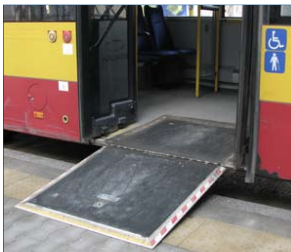
Składana platforma dla wózków inwalidzkich.

wewnątrz pojazdu. Nie powinny one się znajdować w środkowej części drzwi, a jedynie na ich obrzeżach lub tylko na samych drzwiach , aby nie ograniczać przejazdu wózkom. Pionowe poręcze nie powinny się także znajdować w przestrzeni przeznaczony dla wózków, aby nie utrudniać lub wręcz nie uniemożliwiać manewrowania wózkiem. Dodatkowo w miejscu przeznaczonym do przewozu niepełnosprawnego na wózku, wzdłuż ściany powinna być zamontowana poręcz na wysokości dostępnej dla osoby siedzącej na wózku. Poręcz ta umożliwia bezpieczne przemieszczanie się wewnątrz pojazdu.